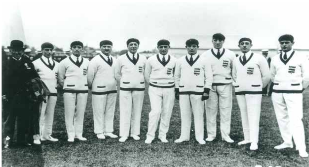
Monaco à Amsterdam en 1928

Nous savons que la Principauté de Monaco a toujours été le siège de manifestations artistiques, culturelles et sportives qui ont contribué à sa renommée internationale et en 1993 Monaco a accueilli la 101 ème session du CIO qui, un an plus tard, décernera au Comité Olympique Monégasque la «Coupe Olympique Pierre de Courbertin» pour sa parfaite organisation. C'est d'ailleurs Monaco qui aura l'honneur d'organiser les 8 et 9 décembre 2014 la 127 ème session extraordinaire du CIO.