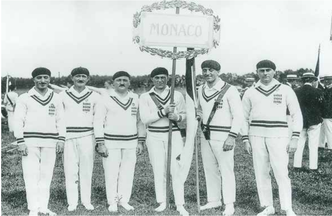
Un concours artistique apporte à la Principauté de Monaco, aux Jeux de 1924 à Paris une médaille de bronze en architecture décernée à Julien Médecin pour son projet de stade à Fontvieille

Pœi, ùn 1981 a Baden-Baden, suta u patronage d'ù CIO, i Cumitai Ulìmpichi d'œtu picin stati se sun reünii per pensà a u modu da fà per organizà de gioèghi a so' mùsura e ùn 1984, i Gioè-