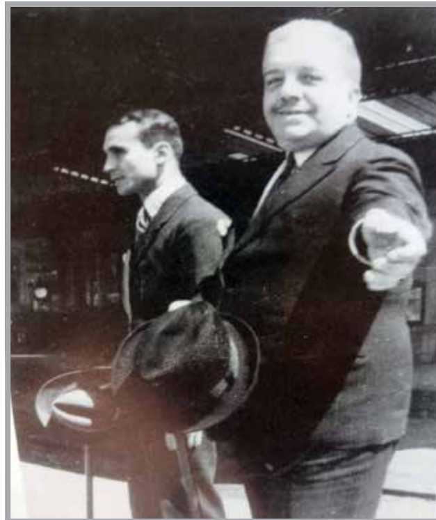
■ Serge Diaghilev