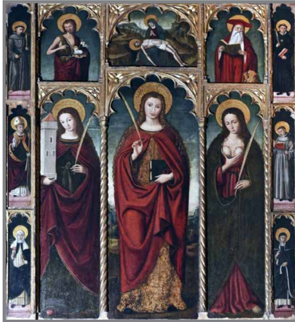
■ Le retable de Sainte Dévôte de Louis Brea (1517) en l'église paroissiale Sant'Antonio de Dolceacqua

Gh'è tambèn ünt'a Catedrala de Mùnegu ün'obra autenticà de Louis Brea ma se trata d'u retàura de San Niculau che è stau pagau da tüt'u pòpulu e terminau u 20 d'austu d'u 1500. De fati ün achëst'època San Niculau era u santu u ciü venerau a Mùnegu. Era u san patrùn d'a gèija parruchiala. Santa Devota nun era ancora a santa prutetriça d'i Munegaschi. Sci'u retàura figüra sulu sci'üna strënta fàscia sci'u custà. U so cültu s'è desvelupau ünt'a segunda parte d'u sèculu XVI cuma ne testimonia u retàura de Santa Devota, espusau tambèn ünt'a Catedrala e regalau ünt'i ani 1560-1570 da Isabela Grimaldi, a spusa d'u Principu Unuratu I mu , ma nun è de Louis Brea, è sulu l'obra d'ün pintre anònimu d'a scøera ligüra.