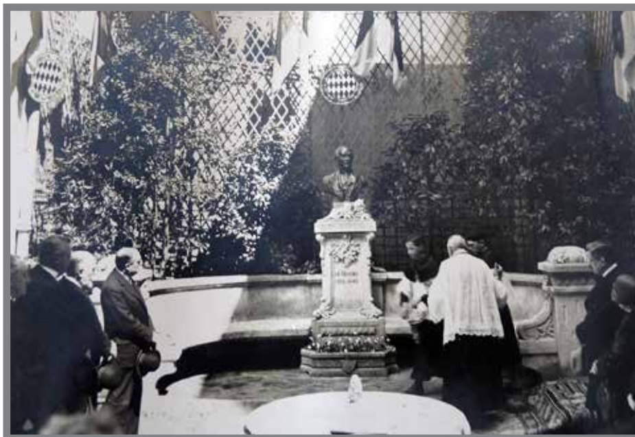
■ Inauguration de la Placette Bosio le 25 avril 1929 en présence du Prince Louis II

« Le Comité des Traditions Locales qui a pris l'initiative de perpétuer les usages de nos temps anciens, ne saurait oublier d'immortaliser ceux de nos compatriotes qui ont puissamment contribué à la gloire de notre pays en portant, à travers le monde, la renommée de la Principauté. Depuis longtemps déjà, notre Comité se préoccupait de rendre un hommage public au célèbre sculpteur et de rappeler à nos compatriotes la qualité de ses œuvres et la grandeur de son nom.