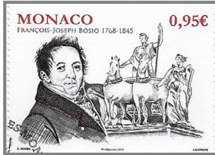
■ Timbre émis pour le 250e anniversaire de la naissance de F.-J. Bosio avec la représentation du Quadriga de l'Arc de triomphe du Carrousel

se chëli lüjun cuma ün batafoegu, achëstu lüje ciancianin tambèn : suvra d'a nostra Roca, ün chëstu löegu, lüje mudestu cuma ru calèn