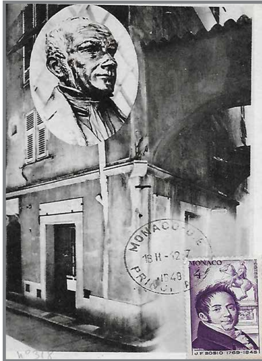
■ Maison natale de Bosio 18 rue Comte Félix Gastaldi sur le Rocher (à noter l'erreur sur le timbre : la date de naissance de Bosio 1768 et non 1769)

Ûncantau da u so travayu, Denon gh'â fau cunusce l'Imperatrice Josëphine che gh'â utegnÿu vârie cumande. Ê cusci che ûn 1810 â scÿltau u büstu de Napuleÿn. Bosio â riesciÿu ûn tale capu d'œpera che, segundu tÿt'i critichi, suvrastava chëlu de Canova. D'aura ûnlâ, a curte imperiala gh'â fau cunfiança fândughe ûn mÿgiu de cumande.