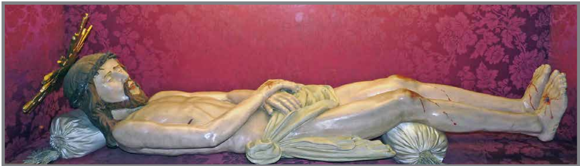
■ Le Christ-mort (gisant) attribué à François-Joseph Bosio dans sa châsse de la Chapelle de la Miséricorde

si ceux-là brillent comme un feu de joie, celui-ci brille aussi, mais tout doucement : sur notre Rocher, en cet endroit, il brille modestement comme le chaleil.