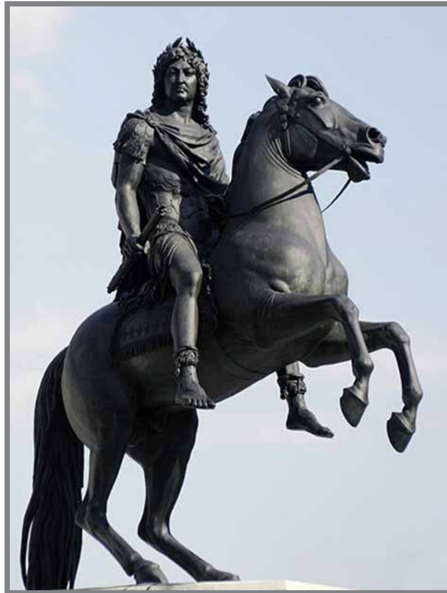
■ Statue équestre de Louis XIV Place des Victoires à Paris (1822)

A revulüçiùn d'u 1830 gh'à fau perde u so postu uficiàle e « da sügüru à pensau à so' casa e a u so païse per se stremàghe. L'à scritu meme a so nevu, u dutù Hercule Bosio a Niça, u seze d'a Madalena d'u 1836.»