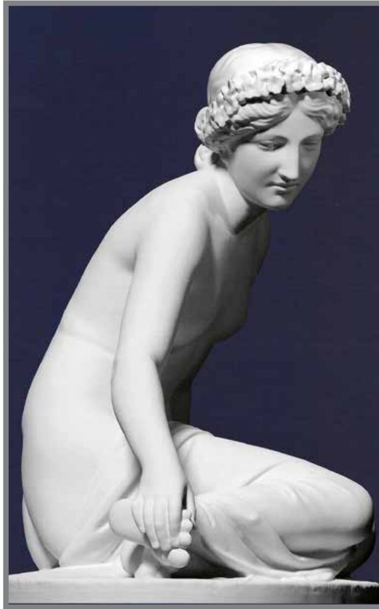
■ La Nymphé Salmacis (N.M.N.M., scan 3D réalisé par Oliver Laric) Lors de la cérémonie de clôture du Festival International de Télévision de Monte-Carlo, une statuette la représentant est décernée aux lauréats.

d'u piciùn munegascu curagiusu ch'â vusciüu vive de travayu e d'arte e s'è fau ricu, è diventau famusu, è stau primu scültù de Bonaparte !