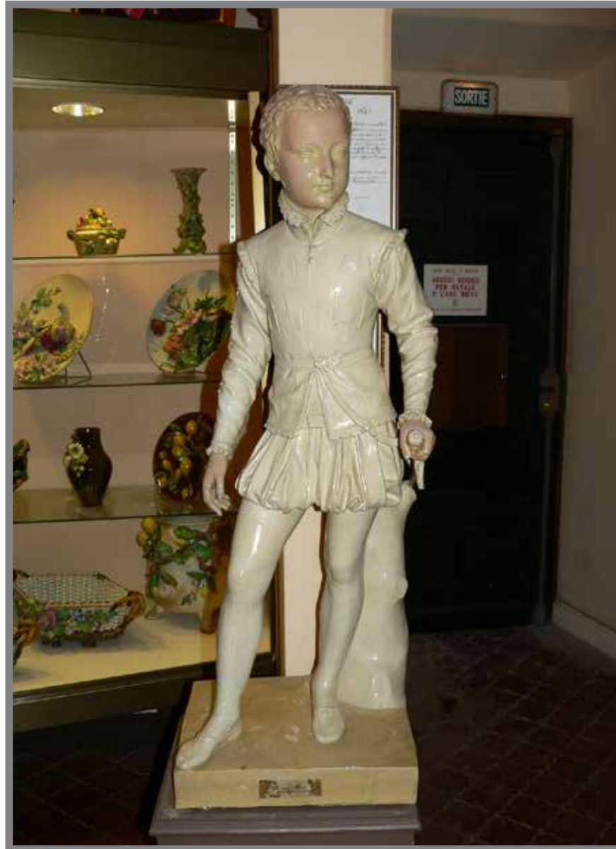
■ Henri IV enfant (Musée des Traditions Monégasques)

(Souvent pris au sens figuré : réponse que l'on fait quand on vous propose le choix entre deux conduites également désagréables pour vous)