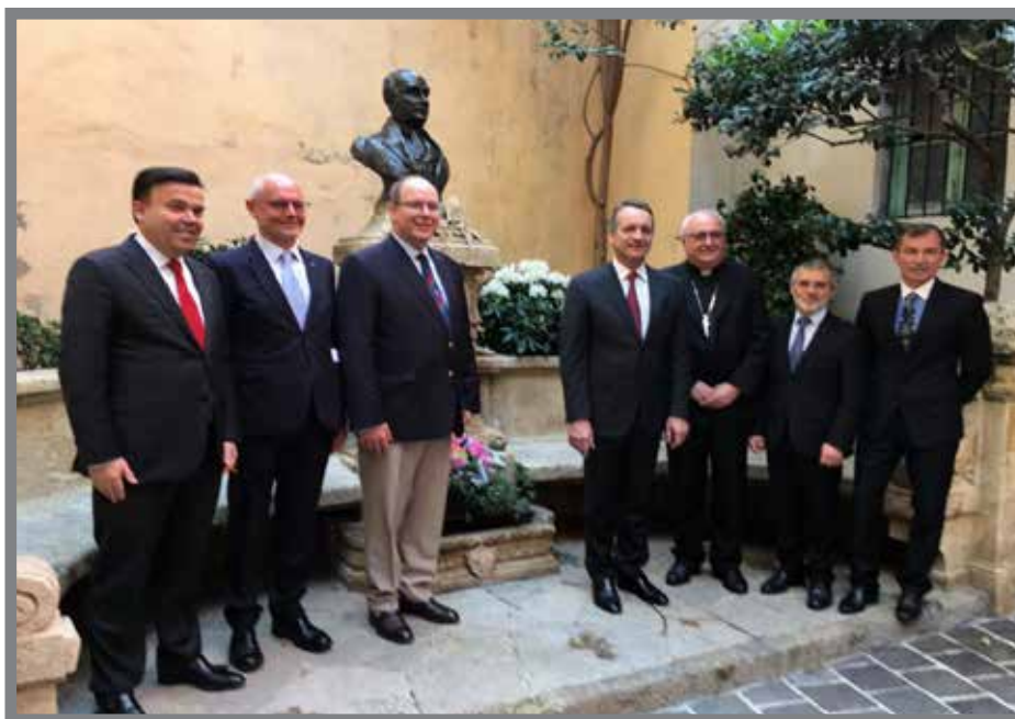
■ Commémoration du 250ème anniversaire de la naissance de François-Joseph Bosio en présence de S.A.S. le Prince Souverain Albert II