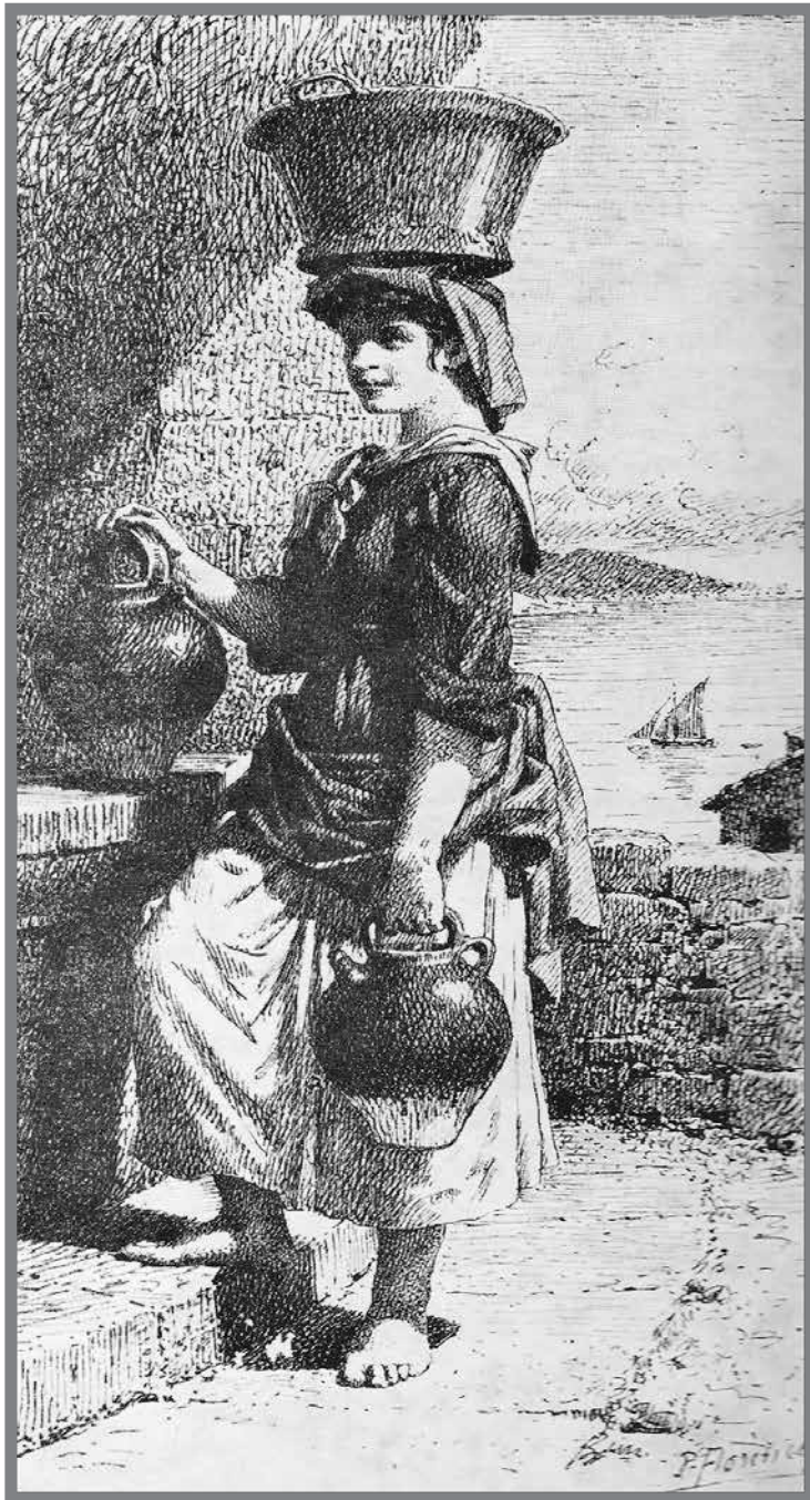
■ Roquebrunoise à la fontaine