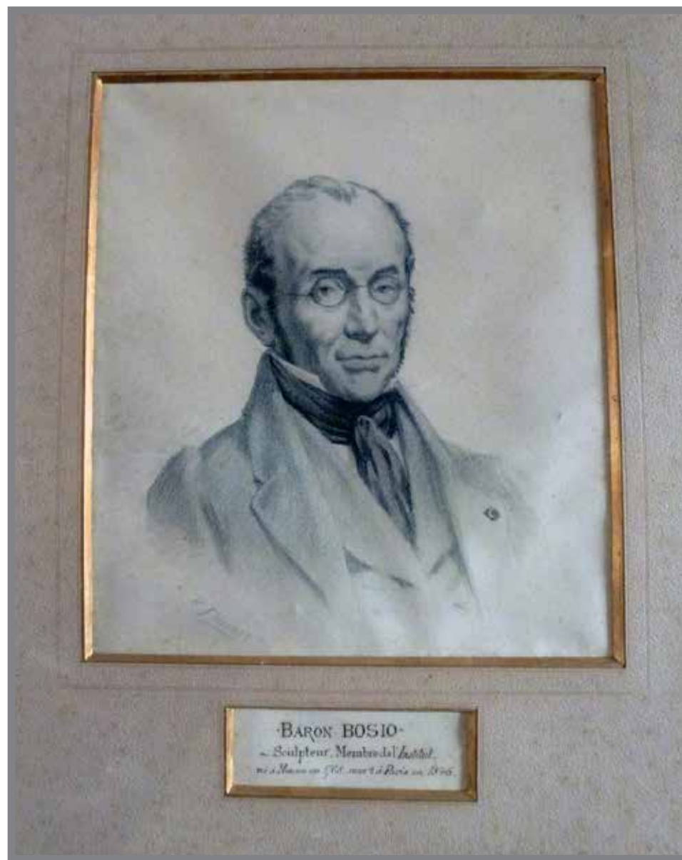
■ Portrait du sculpteur F.J. Bosio par un autre grand artiste monégasque Philibert Florence

Dopu a morte de so pàire, à ünstallau u so atelié a Mentùn. À decurau tante bele case d'u mentunascu, vilae che se favun basti i richi ünglesi e rüssi de l'aristucraçia ma, suvratütu s'è dau prun da fà per ünsegnà u dessignu e a pintüra a ë züvene erede d'achësti richi osti. Philibert Florence era tantu bravu cun tüt'i modi de pintà, œri, aquarela, pastel, fresca e gh'avëva üna gran varietà de mutivi : figüre, cumposiçiue, alegurie, purtrei, paisagi, natüre morte. « Tüt'è soe obre sun clàssiche ma a freschëssa d'è curue, a finessa d'u dessignu, a duçü d'è furme caraterizun u so ingegnu ; prova evidenta d'ün stile, se recunüsce sùbitu ün'obra de Florence e sempre, se ne desgàgia üna felicità, ün'armunia che ne permëtun d'affirmà che é stau ün prun gran pintre ».