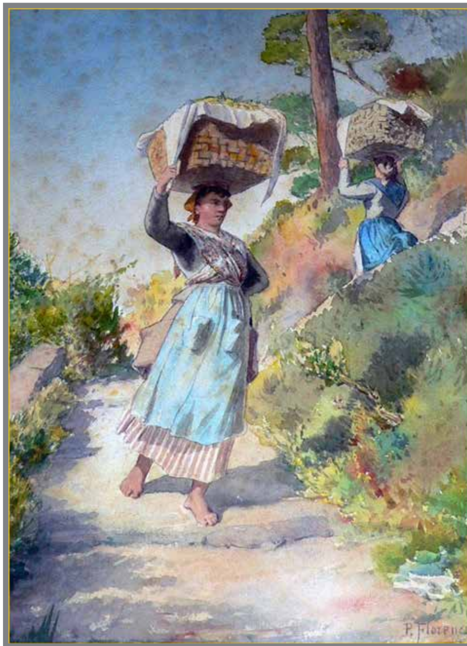
■ Aquarelle de Philibert Florence : Paysannes de retour de la cueillette des citrons

È nasciüu ünt'üna famiya munegasca d'artisti cuma u so päire Fortuné o u so barba Hercule. Nun se pò dunca se stunà che, da prun züvenu, se fussa passianau per u dessignu. Ün 1859, a vint'ani, cun üna bursa cuncessa cun generusità da u Principu Carlu III cu , se n'è partiu a Ruma per fà seriusi stüdi de dessignu e de pintüra. De returnu da Ruma, è stau üncargau de refà ë fresche d'u plafün d'a Sala d'u Tronu e, cun diversi pintri, à travayau à decuraçion d'ë Sale d'u Palaçi e tambèn d'a Galaria d'Àrcule. È da chëli tempi che, cun u pintre Ernesto Sprega, ün carga de decurà a Capela Palatina, à mantegnüu d'ecelenti ligami.